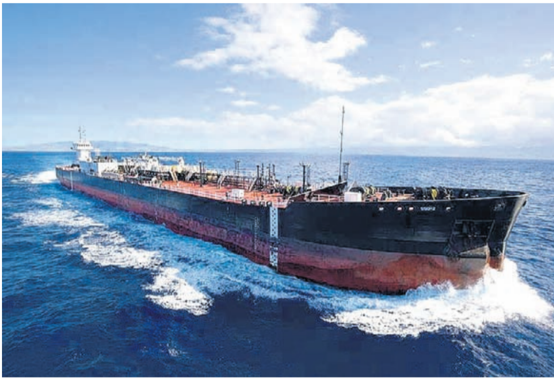
(LaPatilla/Reuters) – Tin varios tanker stanca riba lama cu ta transporta dos luna di produccion Venezolano cu no por a bende. E motibo ta cu e producto

no a haya comprador te ainda entre e refinerianan na mundo, bao di e menasa di sancion Mericano.